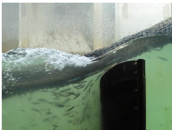
(過去の稚アユの遡上の様子：令和6年4月23日) ※写真右側が上流です。