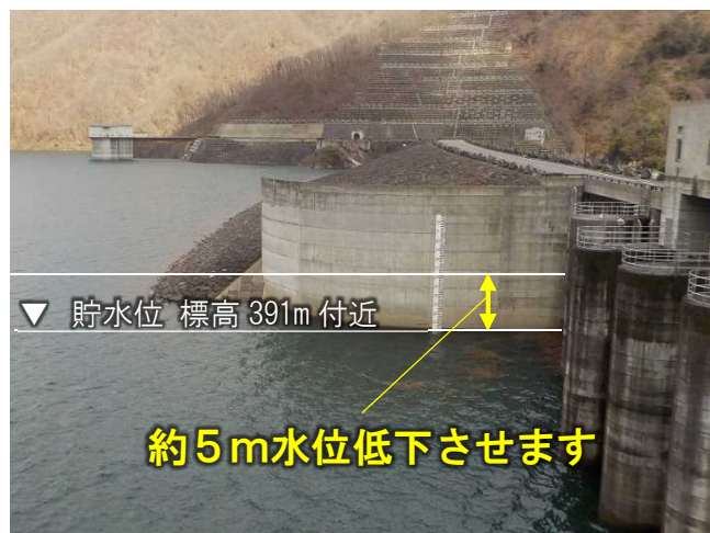
洪水調節容量確保後の貯水位(イメージ)