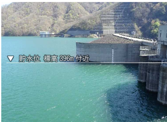
4月7日現在の貯水位 標高約 396m