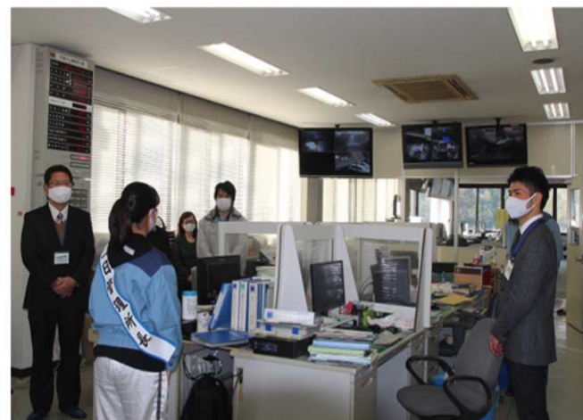
一日所長着任挨拶