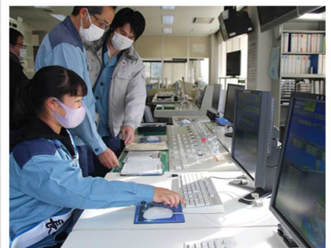
利水放流量の変更指示