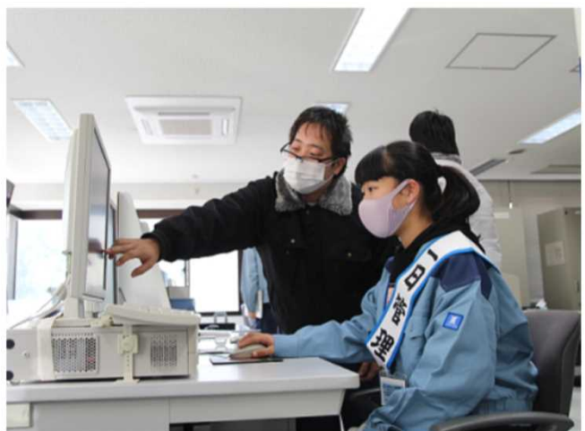
カメラでの施設点検