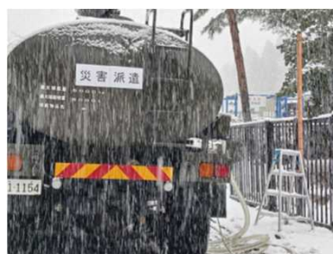
自衛隊車両への給水

1月9日 自衛隊、国が派遣する給水車両に生活用水を給水開始し、珠洲市総合病院、避難所のお風呂で利用（報道各社が可搬式浄水装置による給水支援活動を取材され全国ニュース等で報道）