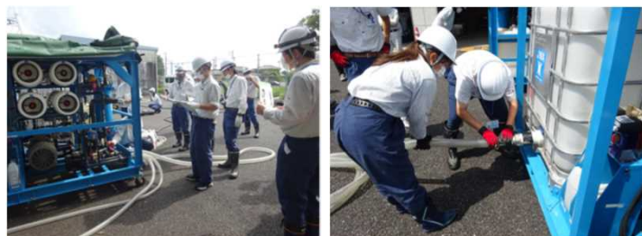
可搬式浄水装置設置訓練の様子

職員は、浄水装置の設置や稼働に速やかに対応できるよう訓練を実施し、緊急災害支援に備えています。