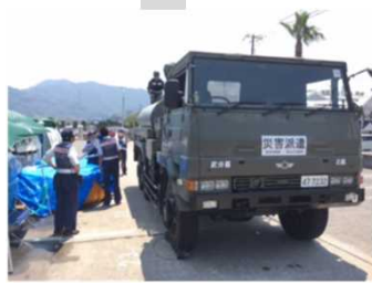
⑧西日本豪雨 広島県三原市