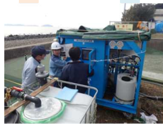
⑦渇水 福岡県新宮町相島