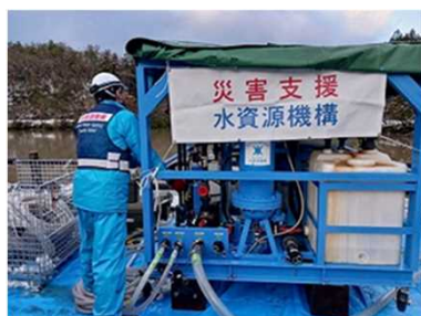
浄水装置の設置を完了