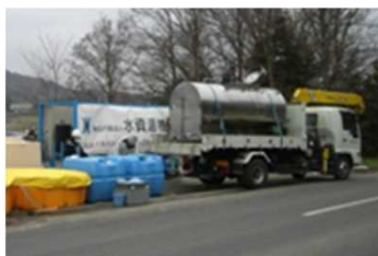
①東日本大震災 茨城県桜川市