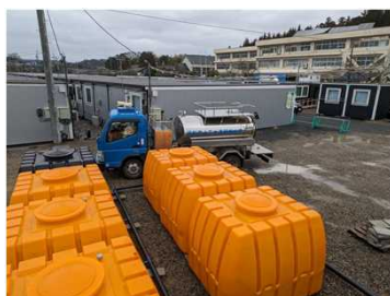
仮設住宅への給水