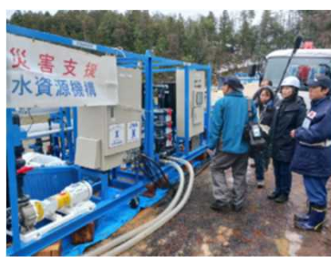
報道機関の取材の様子