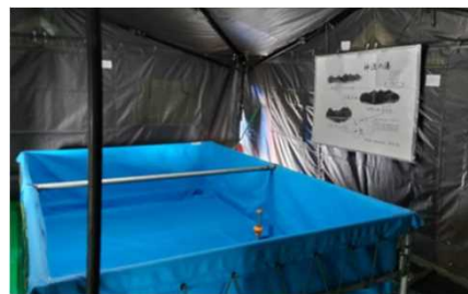
自衛隊が設置したお風呂