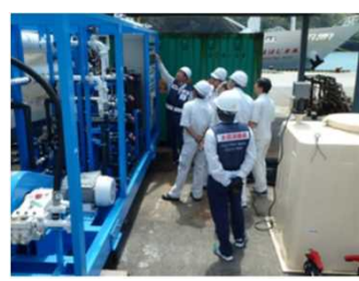
⑩渇水 東京都小笠原村父島