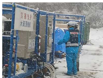
装置の稼働状況を確認