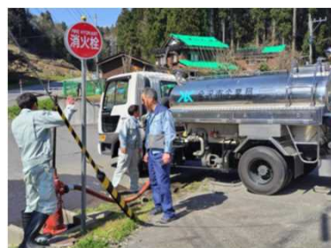
消火栓（水補給ポイント）からの給水作業