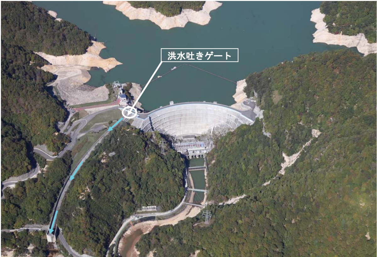
矢木沢ダム洪水吐きゲート