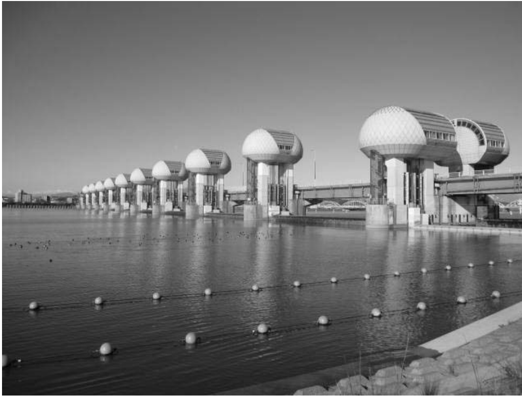
ゲート全開操作終了後の長良川河口堰