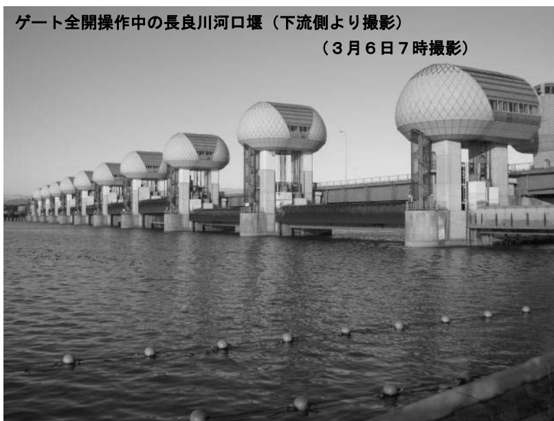
ゲート全開操作中の長良川河口堰（下流側より撮影） （3月6日7時撮影）