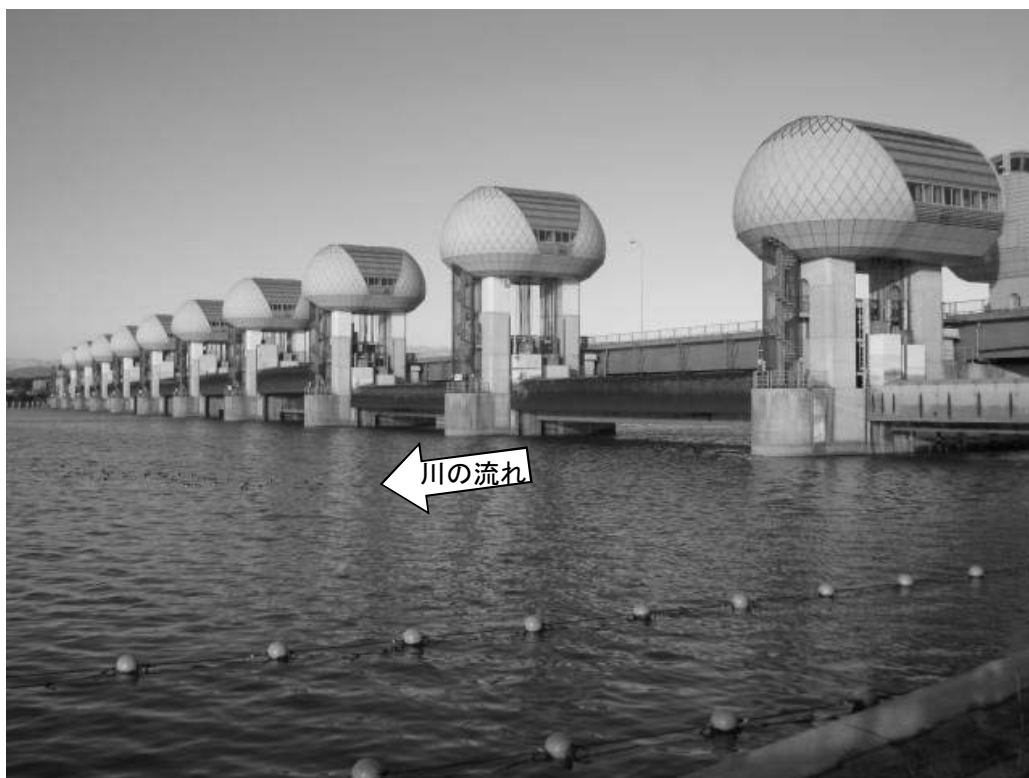
ゲート全開操作時の長良川河口堰（堰下流側）