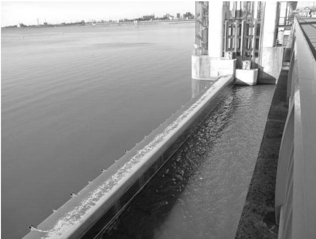
ゲート全開操作終了後の長良川河口堰