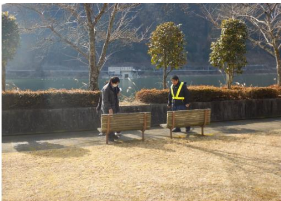
参考 【前回(平成30年2月22日(木))安全利用点検実施状況(ダム入口広場)

取材を希望される場合は、9時20分迄に阿木川ダム管理所 1階会議室にお越し頂ければご案内いたします。