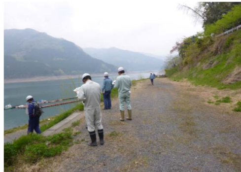
過去の点検の様子