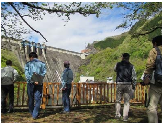
①ダム下流公園（水の広場）

一般の方々が利用する上で危険な場所や立ち入り禁止区域等の施錠の状況等を点検します。