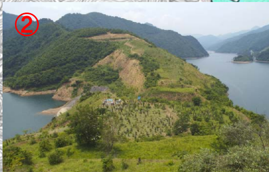
コア山頂上からの眺望