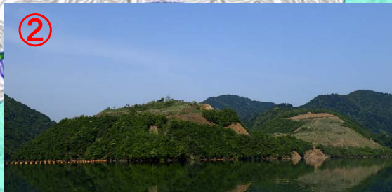
徳山ダム盛立の材料となったコア山全景