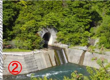
貯水池からの放流口