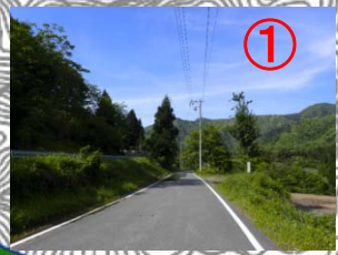
ウォークスタート