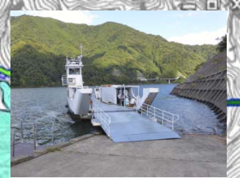
出航場所 (徳山会館)