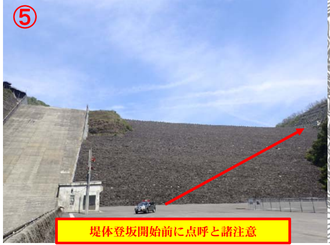
堤体登坂開始前に点呼と諸注意