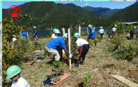
子供たちによるコア山での植樹活動