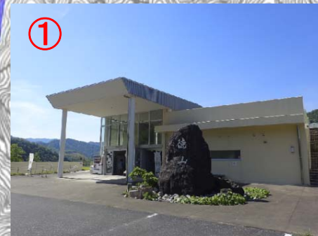
徳山会館 (旧徳山村紹介展示)