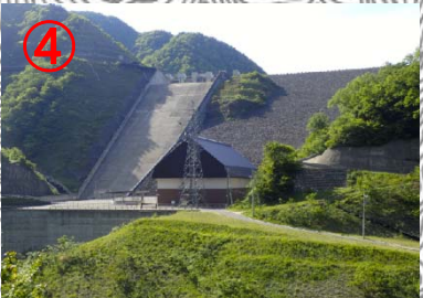
徳山ダムが現れます