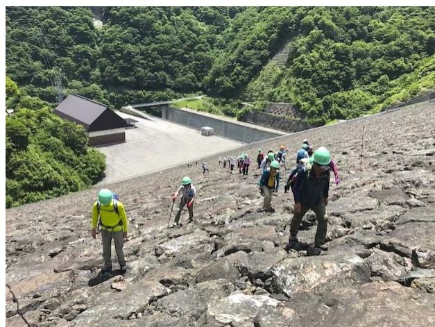
徳山ダム堤体登坂体験ツアーの様子（平成30年5月）