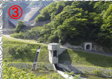
発電所からの放流口