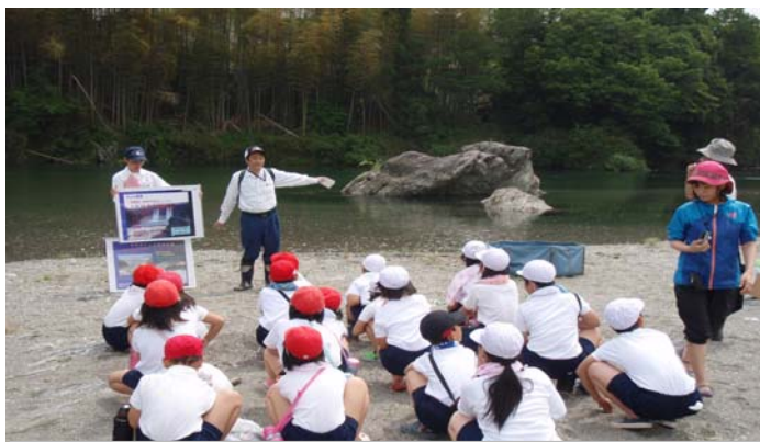
①挨拶・ダムの説明（約10分）