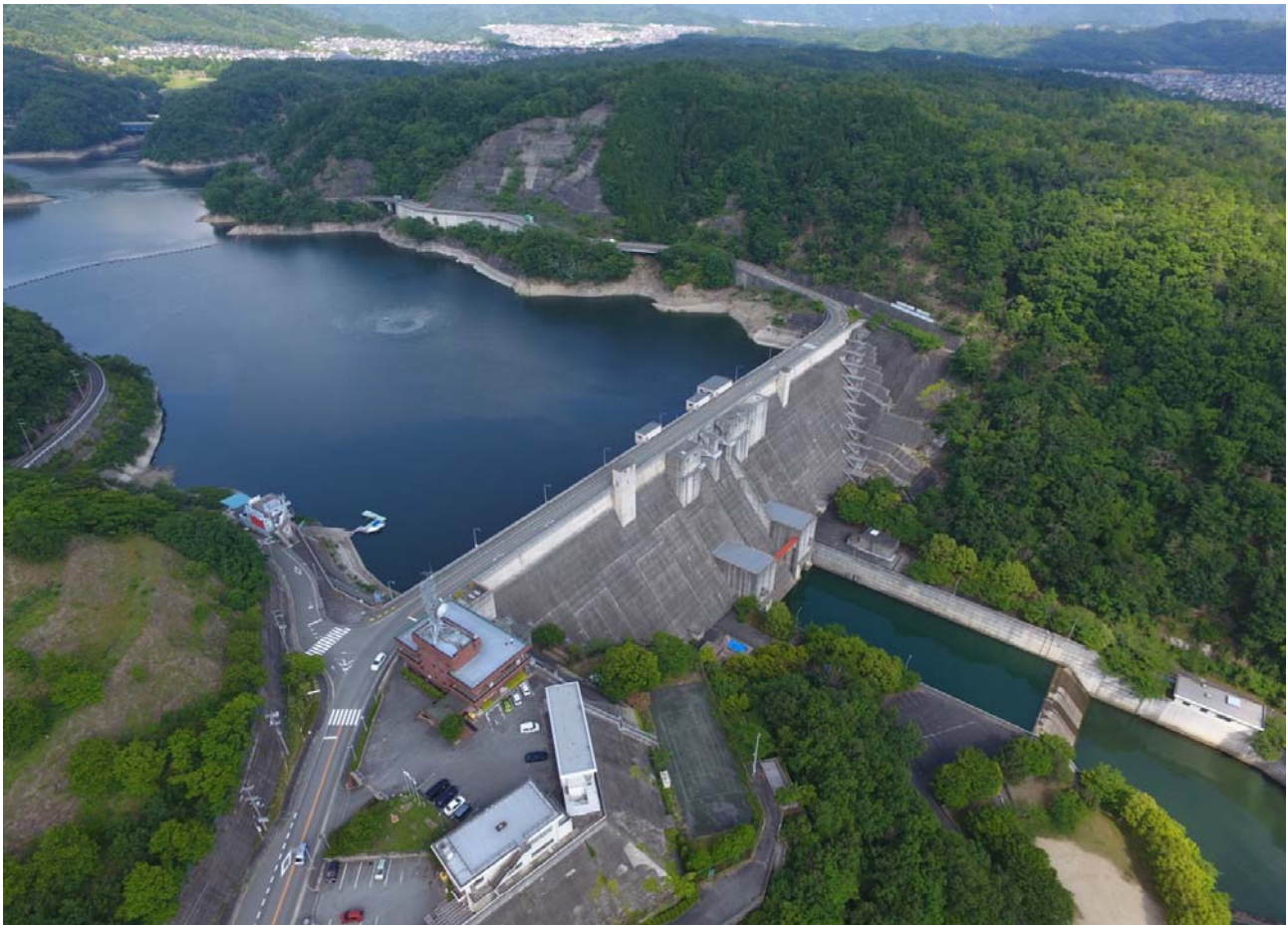
【令和元年6月5日撮影】