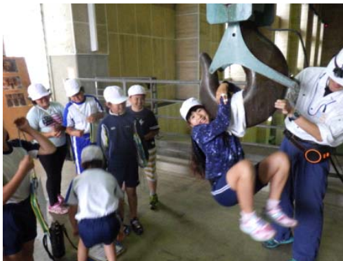
③揚水機場内の見学