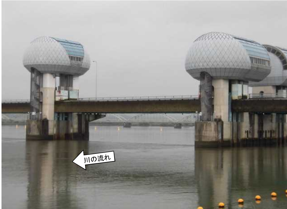
ゲート全開操作開始後の長良川河口堰（堰下流側）