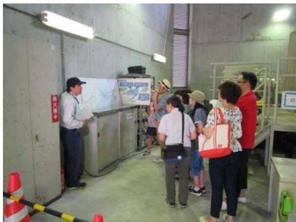
職員による浦山ダムの役割・ダムの設備等の説明