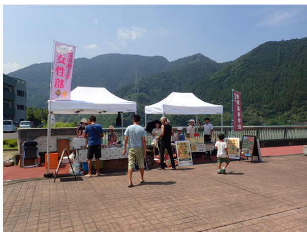
浦山ダム堤体上のイベント受付コーナー・食品販売コーナー