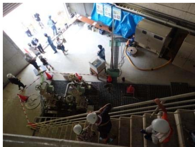
普段は入ることができない浦山ダム内部見学の様子 (左：監査廊 右：放流設備ゲート室)