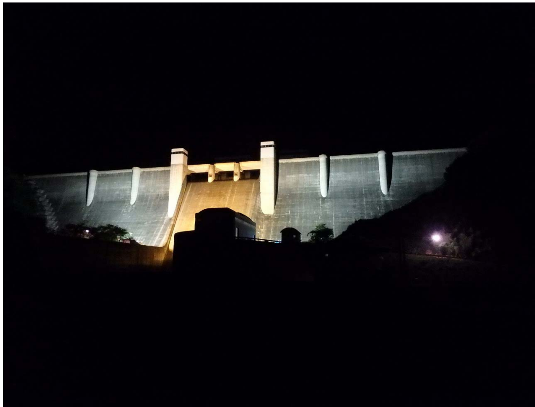
ダム下流から望む