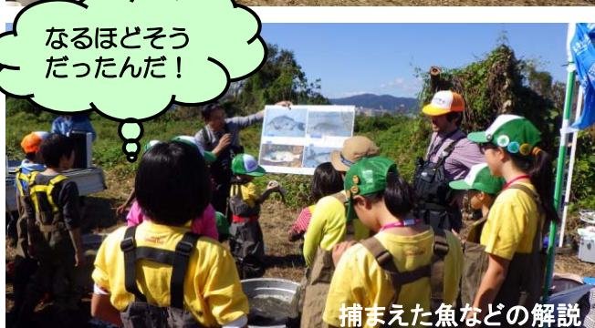
捕まえた魚などの解説