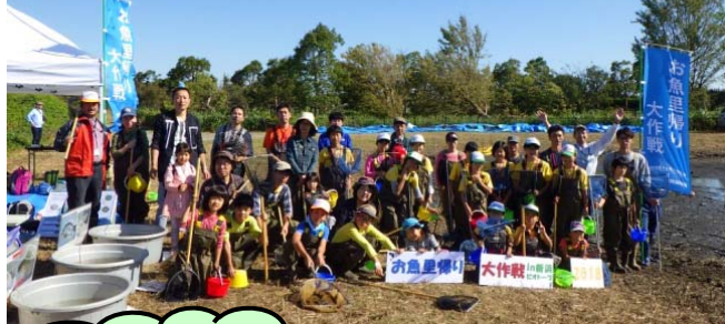
参加して頂いた皆さん