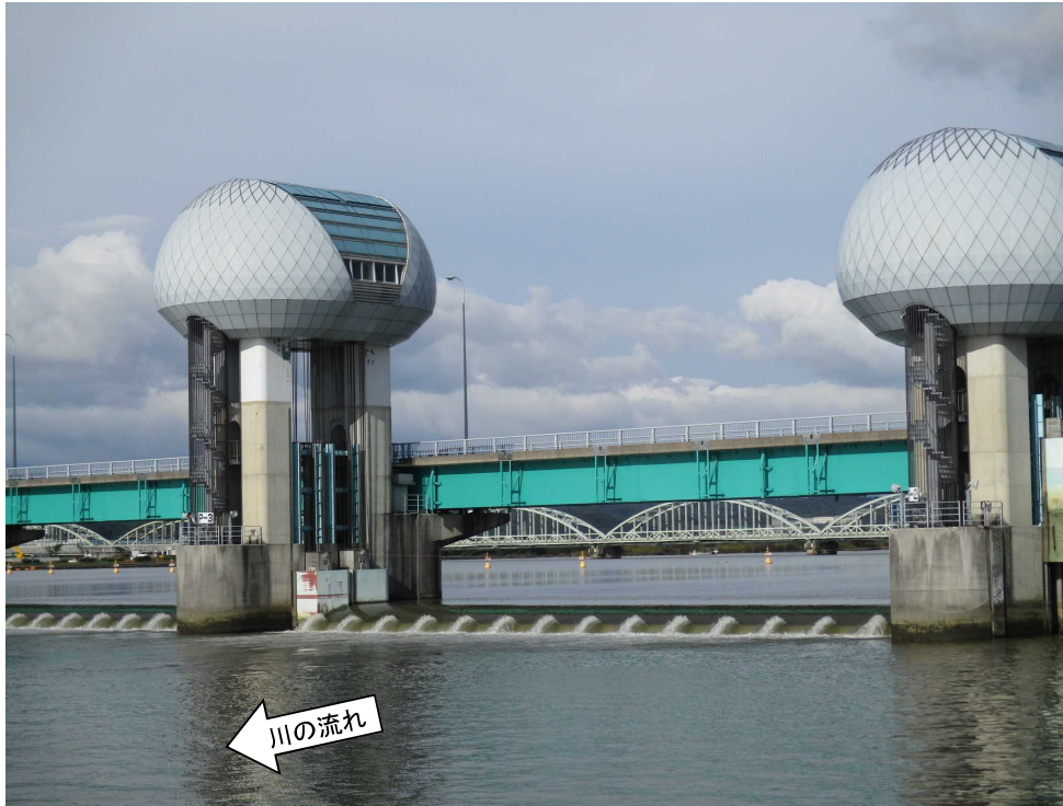
ゲート全開操作終了後の長良川河口堰（オーバーフロー操作に切り替え） 10月26日 9時撮影