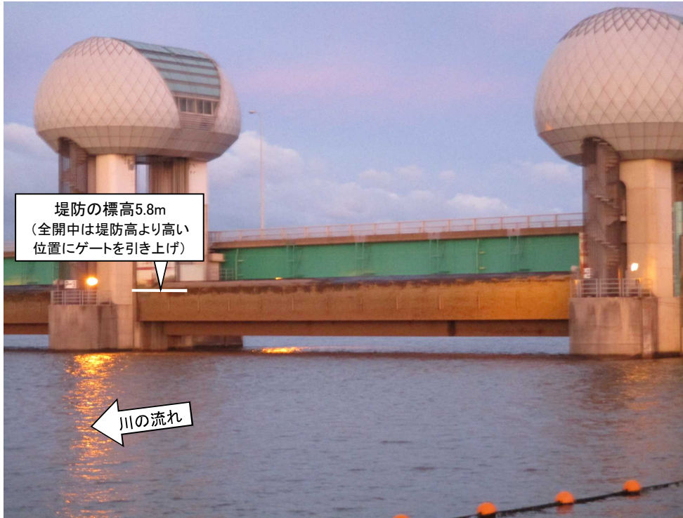
ゲート全開操作終了準備中の長良川河口堰（堰下流側）