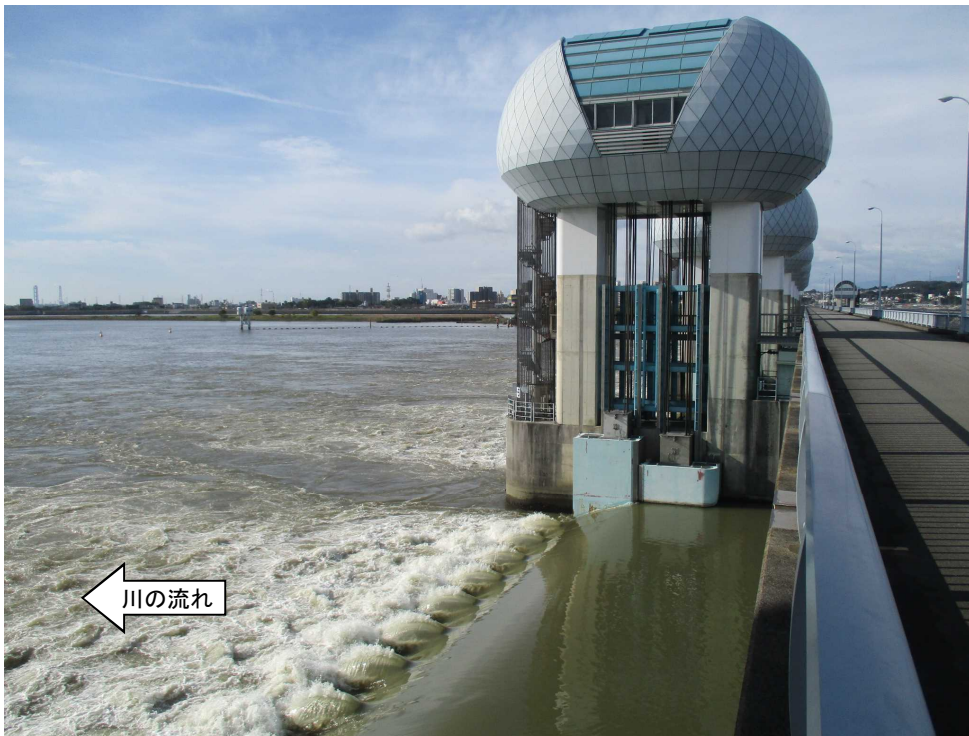
ゲート全開操作終了後の長良川河口堰（オーバーフロー操作に切り替え） 10月26日 9時撮影