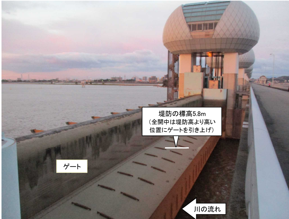
ゲート全開操作終了準備中の長良川河口堰 （全開中は堤防高より高い位置にゲートを引き上げ）