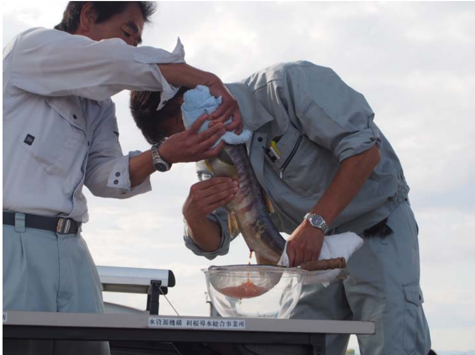
(サケの採卵の様子①)