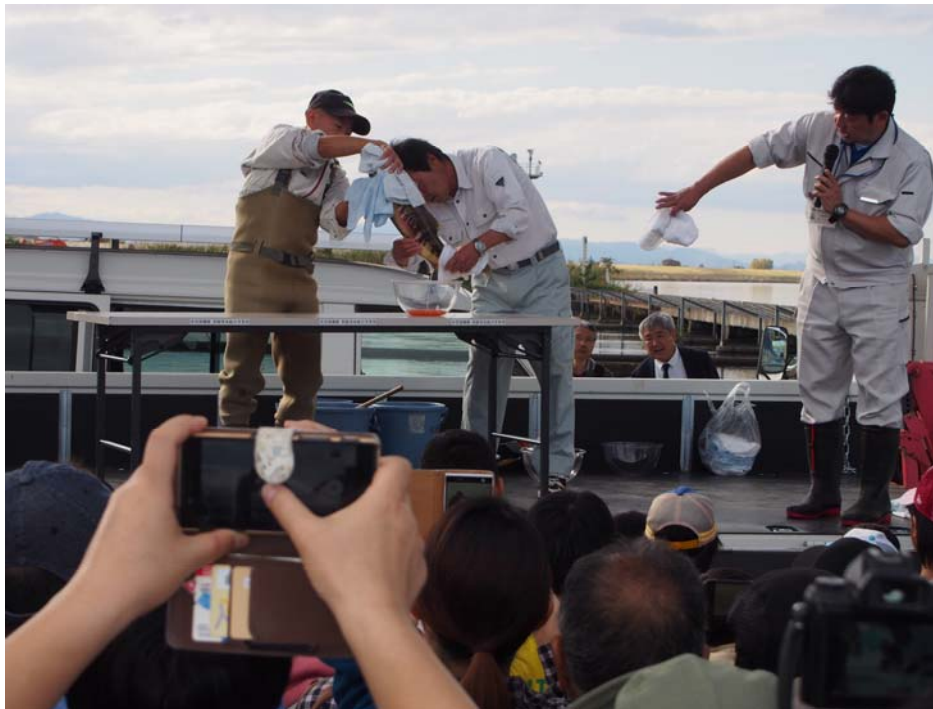
(サケの採卵の様子②)