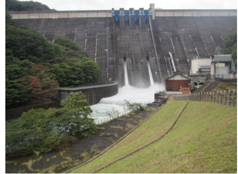
放流中の草木ダム（令和元年10月11日）