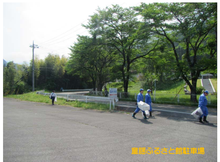
童謡ふるさと館駐車場