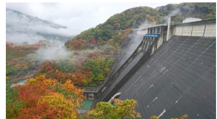
草木ダム周辺の紅葉（昨年11月上旬）