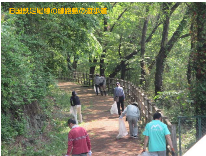
旧国鉄足尾線の線路敷の遊歩道

草木ダムは、昨年引き続き満水となり、農業用水、水道用水、工業用水として必要な水を貯めています。これからも継続して清掃活動を行い、美しい景観を守り、貴重な水資源の流れる渡良瀬川からもゴミがなくなるよう、皆様のご協力をよろしくお願いいたします。