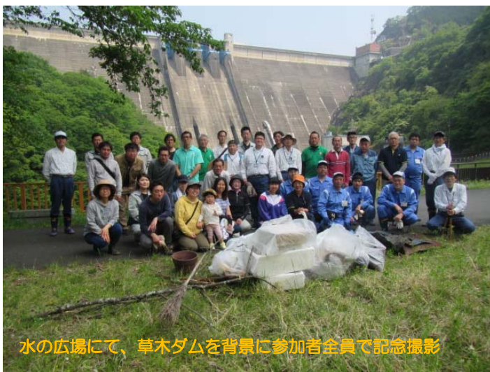
水の広場にて、草木ダムを背景に参加者全員で記念撮影