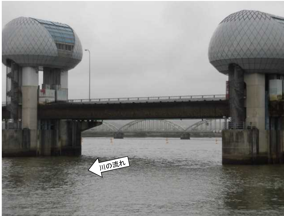
ゲート全開操作開始後の長良川河口堰（堰下流側）