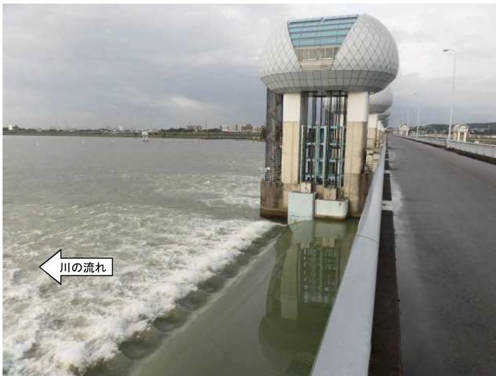
ゲート全開操作終了後の長良川河口堰（オーバーフロー操作に切り替え） 7月29日 7時撮影