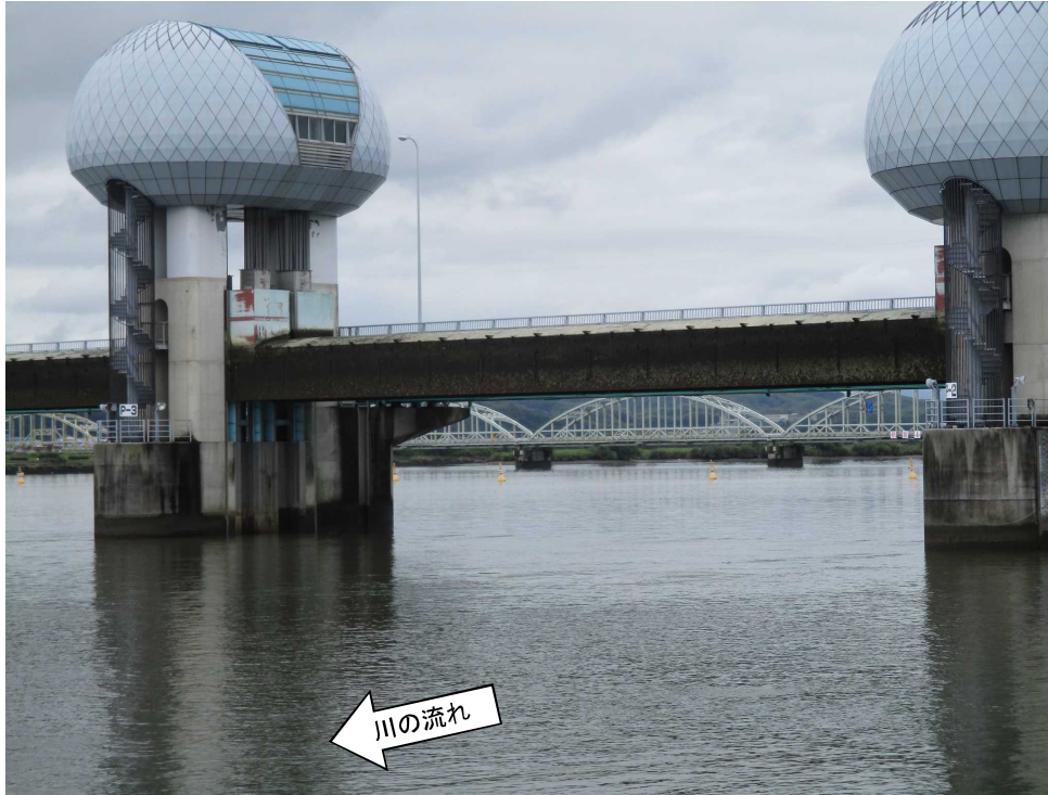
ゲート全開操作開始後の長良川河口堰（堰下流側）