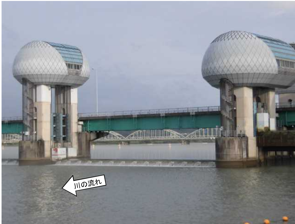
ゲート全開操作終了後の長良川河口堰（オーバーフロー操作に切り替え） 7月29日 7時撮影