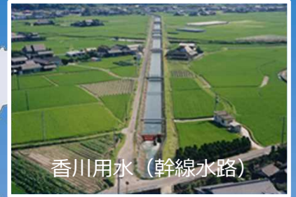
香川用水（幹線水路）

早明浦ダムから香川県の皆様へ水が届けられるまで、かつて水の確保に苦勞された歴史、ダムや水路の役割、安定的に水を届けるため各機関で日夜努力する方々や大切な水を育む水源地域についてご紹介します。