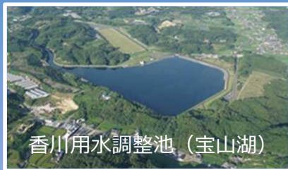
香川用水調整池（宝山湖）