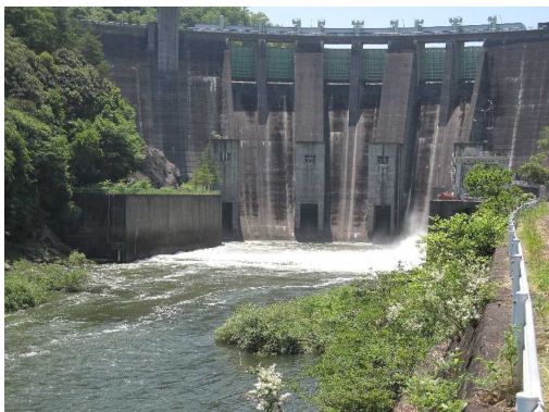
通常の放流（利水放流管）

計画規模を超える洪水時に使用する非常用洪水吐の健全度の確認を併せて行うため、非常用洪水吐から放流を行う予定です。