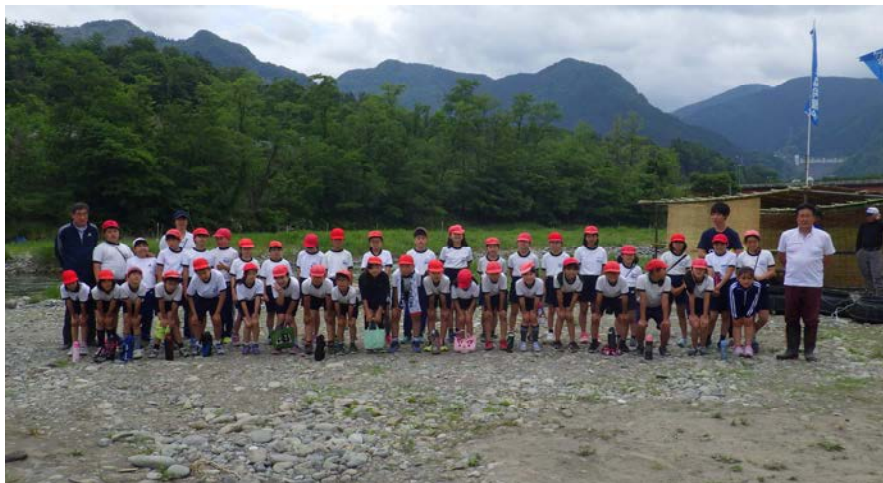
河川敷へ移動してアユの生態・放流についての説明を受けたのち、稚アユの放流。さいごに記念撮影