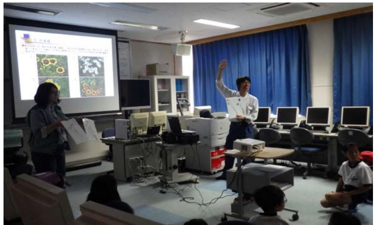
荒川東小学校においてダム周辺の環境についての学習