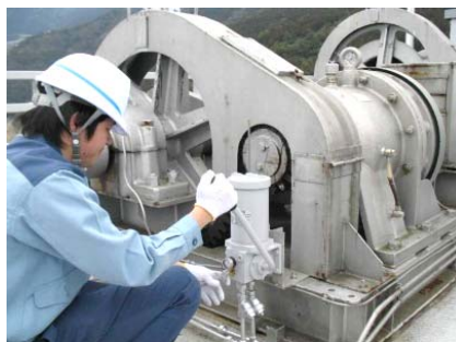
ゲート放流前の機械設備点検状況