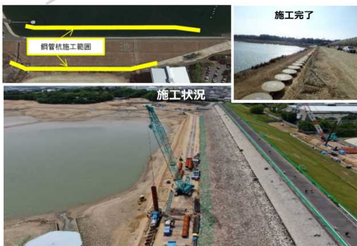
鋼管杭工法による堤体補強