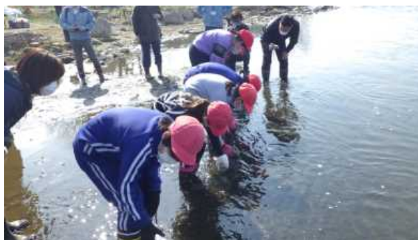
令和3年度の放流の様子