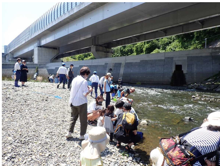
稚アユの放流体験の様子