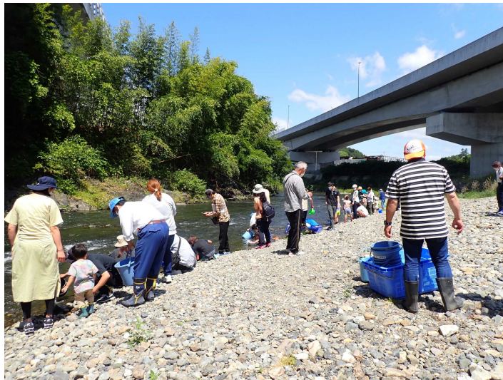
稚アユの放流体験の様子