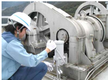
ゲート放流前の機械設備点検状況