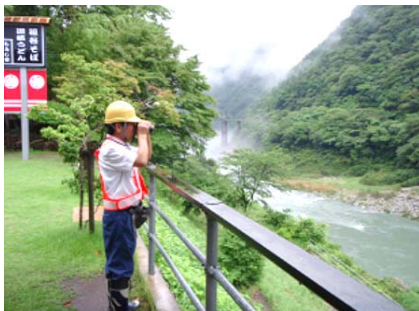
ダム下流河川の巡視状況