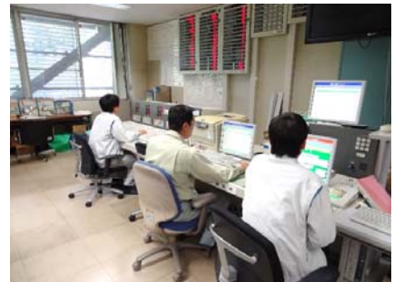
防災操作検討状況