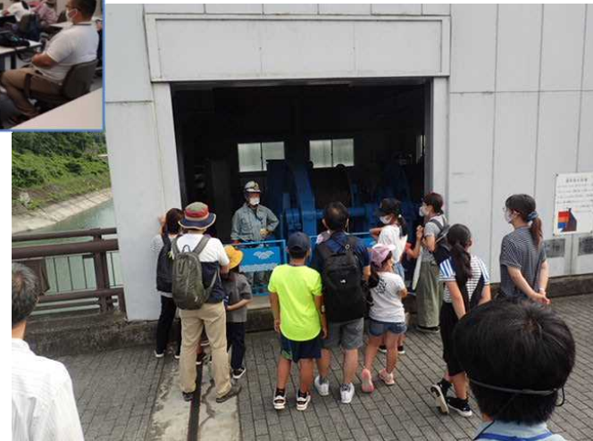
合角ダムゲート室での説明