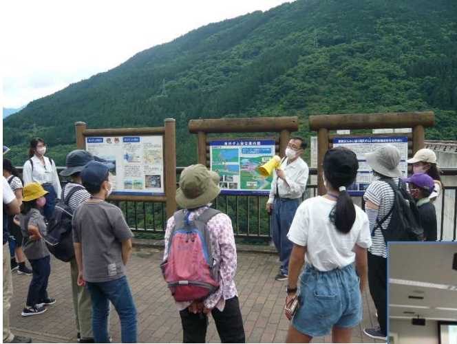
滝沢ダムでの説明