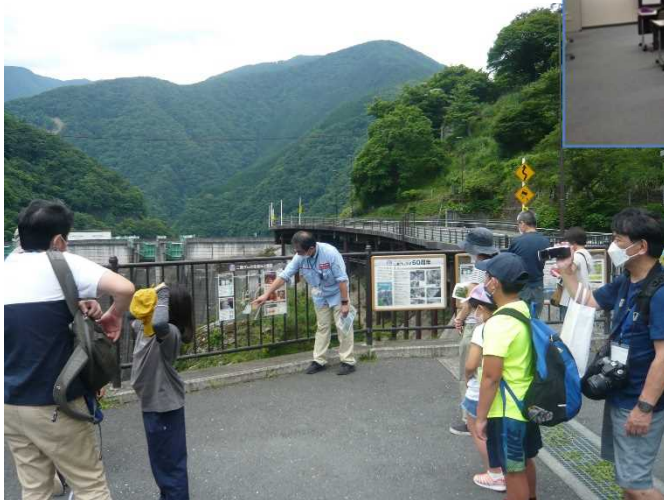
二瀬ダムでの説明