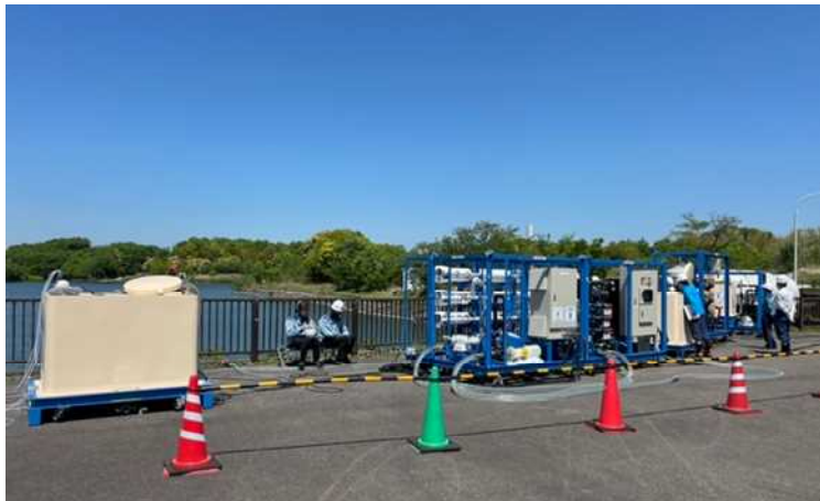
装置全景・訓練時（新1号機）