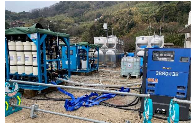
給水支援状況（2号機）

※ 故障等により稼働できないリスクを回避するためのバックアップとして1台を平成24年に調達（可搬式浄水装置2号機）。 ※ 平成18年度に調達した可搬式浄水装置1号機は、令和5年4月に装置更新。