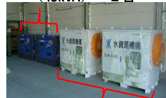
ポンプパッケージ (10m 3 /min/台) × 2台