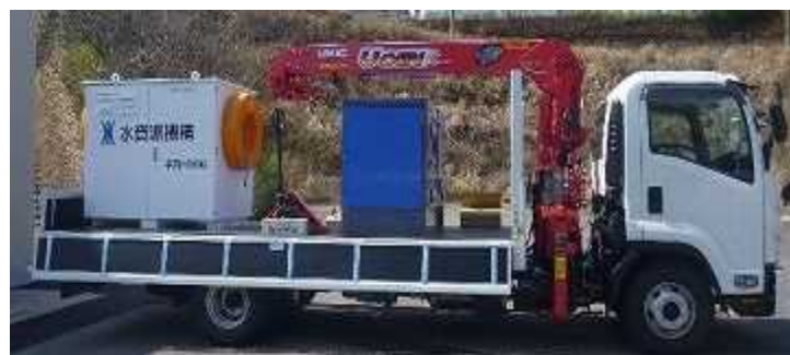
ポンプパッケージ搭載状態 (各1台のみ搭載可)