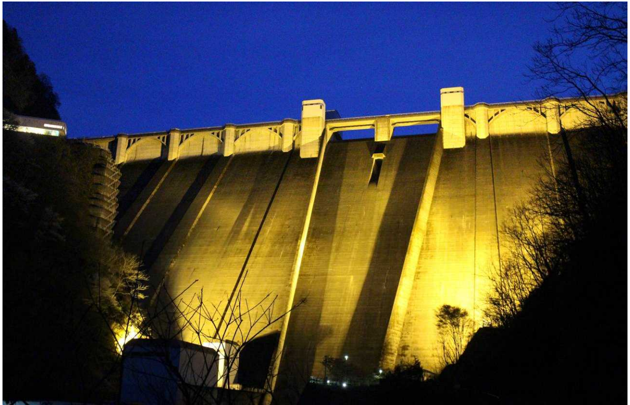
昨年のライトアップ（令和5年3月31日撮影）