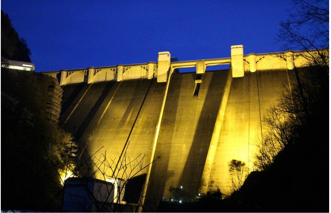
昨年のライトアップ（令和6年4月5日撮影）