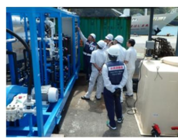
⑩渇水 東京都小笠原村父島