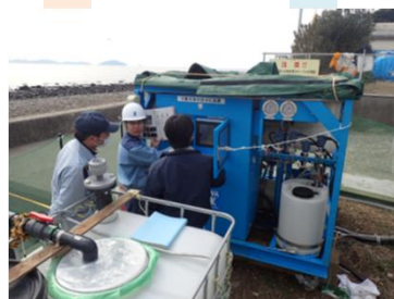
⑦渇水 福岡県新宮町相島