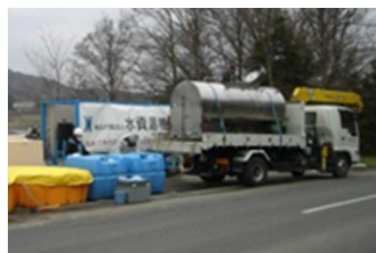
①東日本大震災 茨城県桜川市