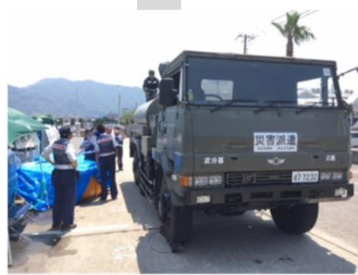
⑧西日本豪雨 広島県三原市