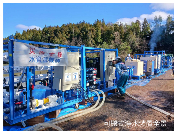
可搬式浄水装置全景

浄水に必要な装置をトラックに積載搬送して、現地で各ユニットを設置し装置を稼働させます。