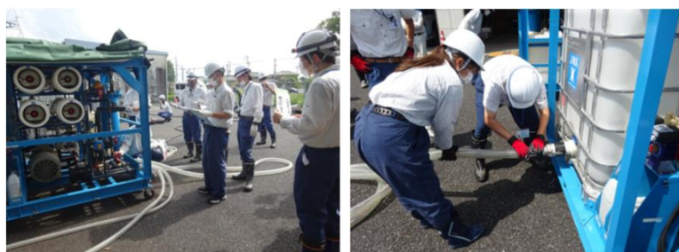
可搬式浄水装置設置訓練の様子

職員は、浄水装置の設置や稼働に速やかに対応できるよう訓練を実施し、緊急災害支援に備えています。