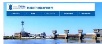
利根川下流 総合管理所HP