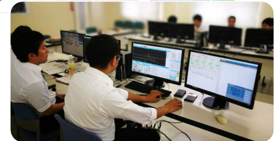
ダム操作シミュレータによる操作技術の向上の取組