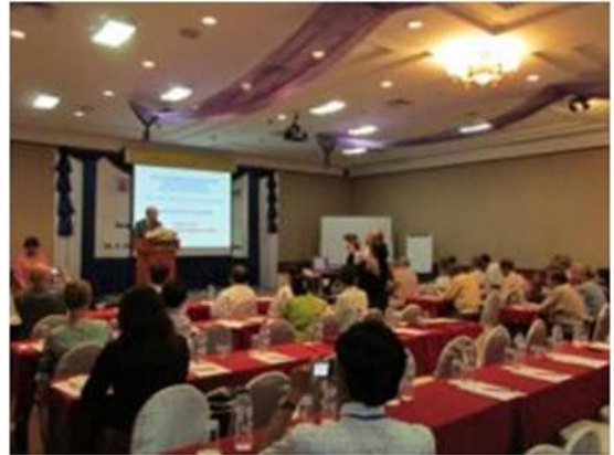
写真-2 ミャンマーワークショップ

機構は、機構の知見と経験を踏まえた総合水資源管理の実施方法について基調講演及びレクチャーを行ったほか、「ミャンマーにおける総合水資源管理の実施にあたり必要なものは何か」と題したパネルディスカッションを行い、機構及びNARBOの経験等を踏まえ、ミャンマーにおける総合水資源管理の実施のための適切な情報発信と支援を行った。