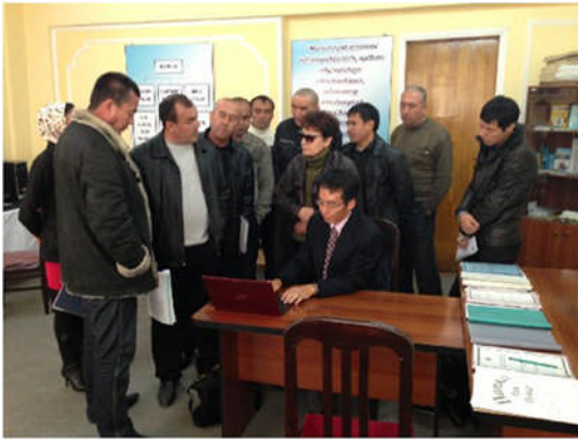
写真－4 水管理セミナー

平成25年11月28日には、TA7547による実証試験やセミナー開催等による能力開発の活動と水利構造物等の改修計画等の成果を共有するための国内ワークショップ（National Workshop）を開催し、関係機関から約40名が参加した（写真－5）。今後のウズベキスタンにおける水資源管理施設への対策の方向性について議論を深めた。機構としても、本業務を通じて水路や圃場における節水を進めるための課題と対策について技術力を向上させることができた。