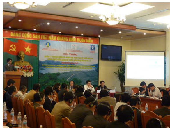
写真-2 日越ワークショップ開催

ベトナム側約160名、日本側60名参加（日本企業は自主参加）という大きな規模となったワークショップでは、「洪水被害軽減のための貯水池管理における先進技術の適用」のテーマに沿って、ベトナム側からは同国の貯水池管理の実情や課題、先進的な取組の紹介があった。日本側からは、まず国土交通省が政策面から水防災の重要性と取組を紹介し、次いで機構が総合水資源管理の実務者としての立場から統合洪水リスク管理や適切な貯水池管理の必要性を説明した上で、パッケージとしてこれらの管理を支援する日本企業の具体的な先進技術紹介を行った。加えてテーマに沿った気象、解析技術等日本企業4社の技術紹介の発表を設けるとともに、休憩を利用したポスターセッションによって参加企業の広報活動支援を行った。