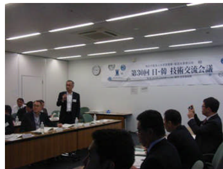
写真－2 第30回日韓技術交流会議