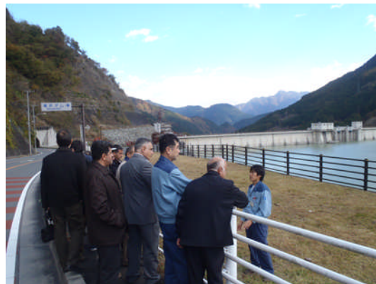
写真-2 ダムの安全管理能力強化の研修