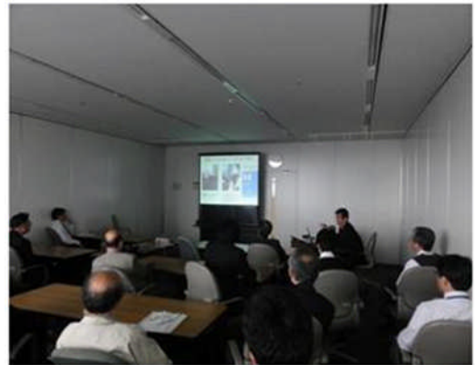
写真-2 国際業務報告会

国際会議参加や受託調査等の海外出張や、国際業務に関連した話題の報告として、平成25年度も国際業務報告会を本社にて計5回開催した。延べ28名の発表者から、海外出張の目的、活動内容、得られた成果等の情報が出張者以外へも共有されるとともに、当該出張を通じて得られたさまざまな水資源管理における課題とその対応手法、国際会議等での情報収集を通じた世界的な水に関する関心事、受託業務実施を通じた成果達成のためのアプローチ等、その情報共有を通じて機構の総合水資源管理等の知見・能力向上に寄与するとともに、参加者との間で活発な質疑・意見交換が行われた（写真-2）。なお、より広範な情報共有を図るため、報告会資料は機構内LAN上に掲載し、全職員が閲覧できるようにしている。