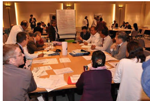
グループディスカッション