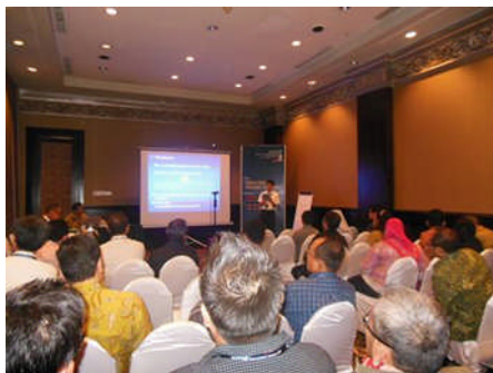
写真－1 インドネシア国際セミナー