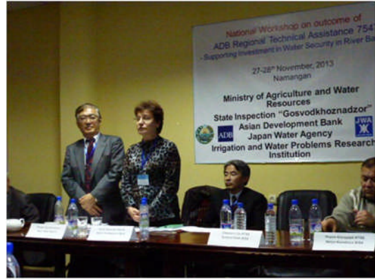
写真－5 国内ワークショップ