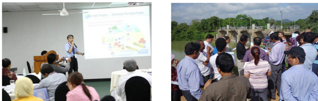
写真－4 NARBO主催の総合水資源管理研修

この研修において、機構は、IWRMガイドラインに基づくIWRMの概念、IWRMスパイラル（IWRMの発展過程における現状を認識するツール）、IWRM推進における課題解決の手法（key for success）を紹介した上で、具体的事例として機構の水資源管理の事例、スリランカのマハベリ川流域での取組事例の紹介を通じて参加者の能力向上を図った。今回の研修では、参加者募集のため、ADBとの連携を密にし、過去最大国数（11ヶ国）からの参加者を得た。参加者からは、IWRMに関する知識の向上、マハベリ川や参加者間での様々な事例を共有でき、また参加者同士のネットワークも構築できた、との評価を得た。