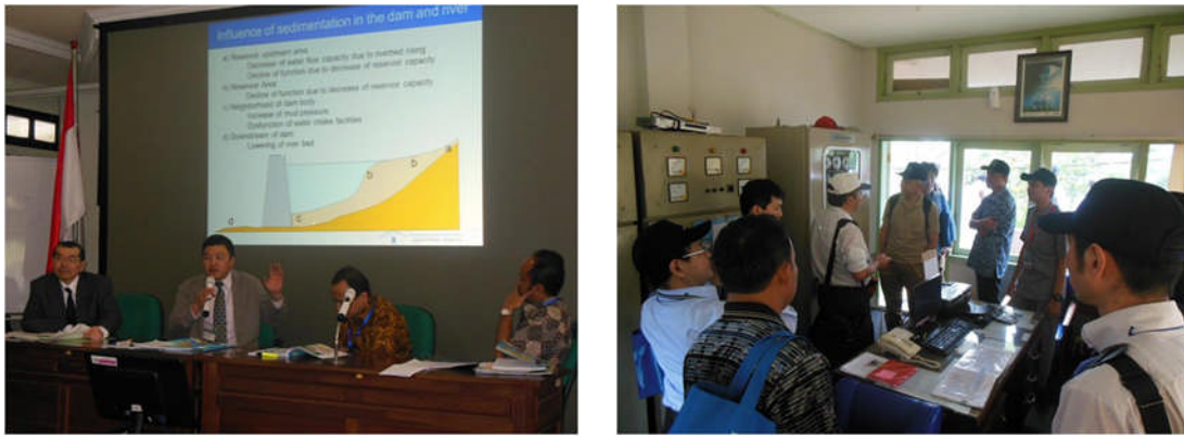
写真-1 インドネシアでのダムワークショップ及び現地調査