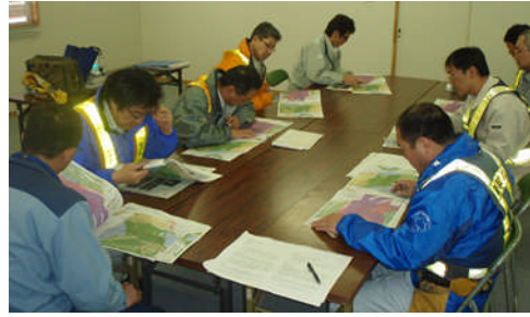
写真-1 津軽ダム 本体工事施工監理業務