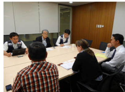
写真-1 フィリピン派遣

平成25年11月、台風30号（Yolanda）がフィリピンに上陸し、高潮などによる史上まれにみる大規模な被害をもたらした。これに対し、政府の要請を受け、国際緊急援助隊の一員として職員1名を派遣し、早期復興に向けた防災計画について、洪水被害対応に関する国内外での知見・経験や関係機関調整の経験に基づきアドバイスをを行った（写真-1）。