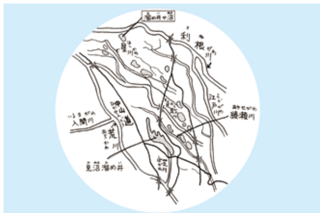
見沼代用水イラストマップ

その後、収穫した米を江戸に運ぶため、見沼代用水と芝川を結ぶ水路・見沼通船堀を造りました。高低差3mの段差を閘門式で解決した原理はパナマ