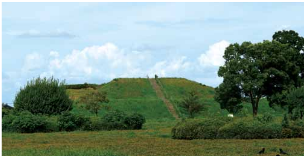
金錯銘鉄剣が出土した稲荷山古墳

戦国時代の争乱が始まった15世紀半ば、武蔵国では生え抜きの武士が台頭しました。なかでも成田氏は、後北条氏と上杉謙信が激しい攻防戦を繰り返す中で巧みに勢力を伸ばし、上杉軍の後退が目立つ