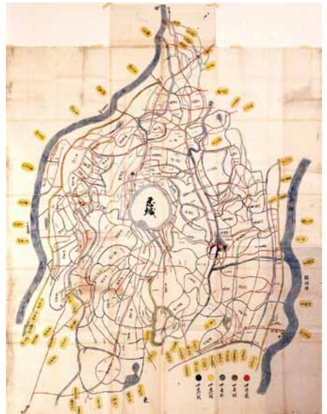
忍藩領分絵図。近世後期に描かれた忍藩領分と他領の村々の図。

寛永年間に参勤交代が制度化されると、大名は江戸居住が義務づけられ、忍城の周辺には中山道、館林道、日光脇往還が整備され、多くの人や物が往来し、にぎわいを見せるようになっていきました。古墳や忍城は道行く人々からもよく見えたようです。