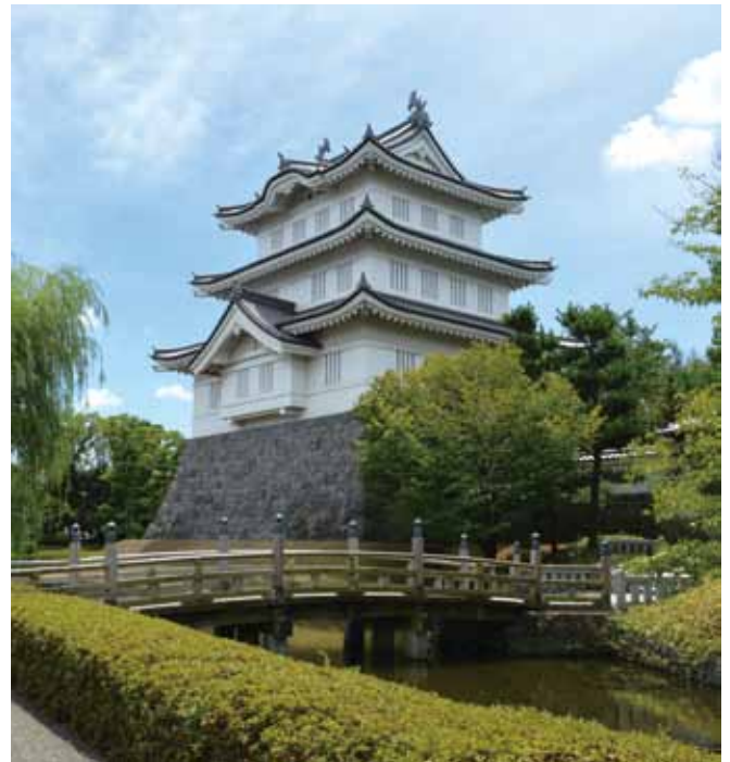
忍城御三階櫓(復元)

明治6年(1873)、かつての城は取り壊され、堀も埋め立てられました。昭和63年(1988)、本丸跡地に「忍城御三階櫓」が再建され、内部は行田市郷土博物館に連なる展示室に生まれ変わり、最上階からは利根川などが一望できます。