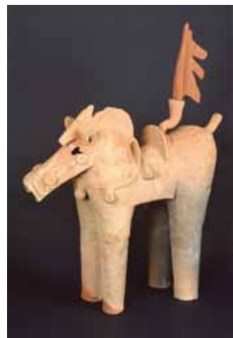
日本で唯一の旗立て馬（埴輪）