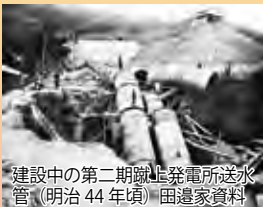
建設中の第二期蹴上発電所送水管（明治44年頃） 田邊家資料