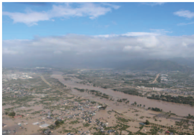
2019年台風19号で千曲川が氾濫

名称を定める必要があると認められる場合に、名称を定めることとしています。今年の梅雨の大雨が「令和2年7月豪雨」と命名されたように、大雨災害については命名されることが多くなっています。しかし、台風には命名されることは少なく、台風には名称がつけられたのは1977年9月の「沖永良部台風」以来、42年ぶりのことでした。