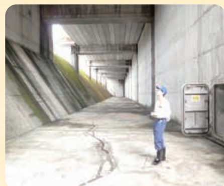
比奈知ダム非常用洪水吐点検の様子

実習の最終日には、川上ダムを訪れた小学生たちを案内するイベントに同行させていただきました。完成したばかりの川上ダムの内部を見学することができて大変嬉しかったと思うと同時に、私が小学生の頃に初めてダムを訪れたことをきっかけにダムに興味を持ち始めてから、今では小学生たちを相手に案内する立場になったことを実感して、見学に同行しながら感慨深い気持ちになりました。