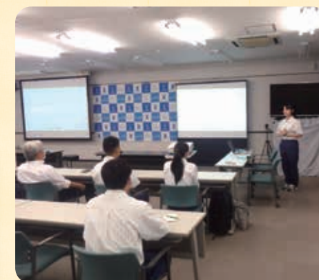
インターンシップ報告会の様子