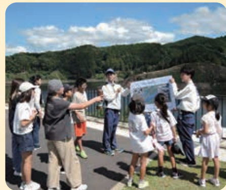
川上ダム見学会の様子

5日間のインターンシップ実習を通して、ダムや管理する施設の点検方法、土砂管理の現状や課題など、多岐にわたる内容を学習し、大学ではできない様々なことを体験させていただきました。特に、私が土砂に関連した研究を行っていることから、ダムの堆砂問題や置土の設置場所の検討など、土砂管理に関して現在進行形で課題となっていることを中心に実習プログラムを組んでいただきました。インターン実習に興味や大きな関心を持って取り組めた上、私自身が取り組んでいる研究が実務上で活かされるかもしれないという、研究に対するモチベーションも高めることができました。この実習で学習した内容や経験を今後の研究や就職活動に還元していきたいです。