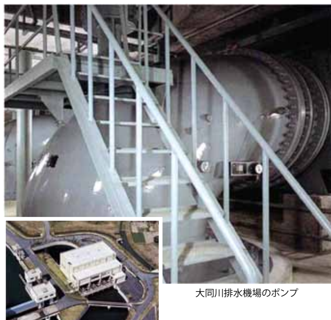
大同川排水機場のポンプ

2週間滞在させて頂く機会がありました。水を安定して供給してもらい大変有り難いとお言葉を頂いたときには、水資源機構に入社して本当に良かったと思いました。水を使われる方はもちろんのこと、先輩職員の方々の役にも立てるよう、これからも頑張ります。」