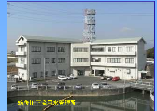
筑後川下流用水管理所