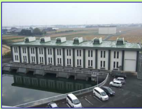
【排水機場(武蔵水路糠田機場)】