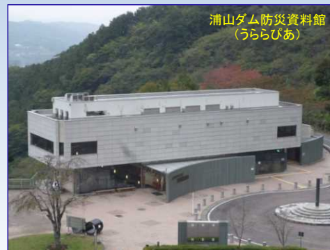
浦山ダム防災資料館 （うららびあ）