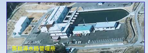
筑後川水路管理所