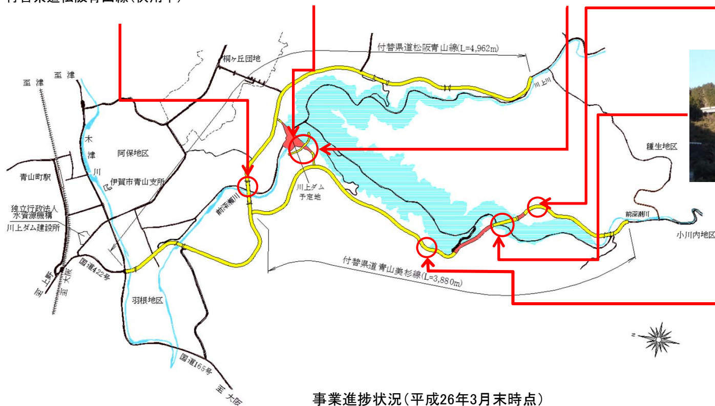
事業進捗状況（平成26年3月末時点）