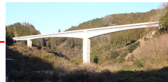
付替県道青山美杉線（猫また大橋）