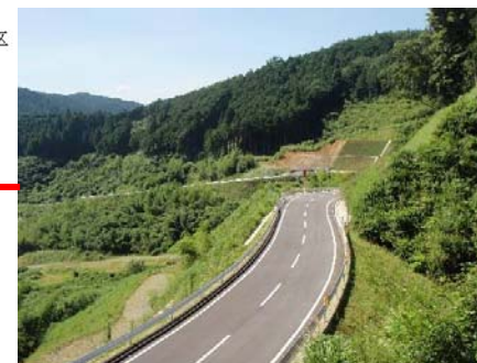
付替県道青山美杉線