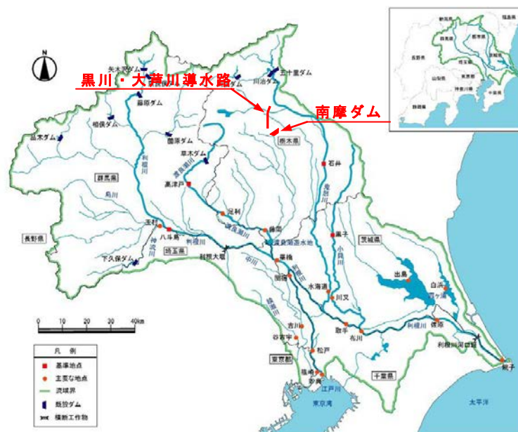
図 1.2-1 利根川水系流域図