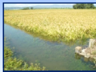
水田が一時的に浸水

水田の浸水被害を軽減し、湛水時間の大幅な短縮効果を目的として、ポンプ能力を決めています。したがって、強い雨が降っているときには、ポンプ運転をしても、しばらくの間は水に浸かることがあります。