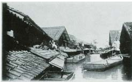
家が浸かる被害！(明治29年9月)

大雨が降って琵琶湖の水が内陸側へ逆流を始めるような場合には、「内水排除(ないすいはいじょ)」という操作を行います。