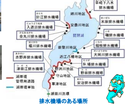
排水機場のある場所