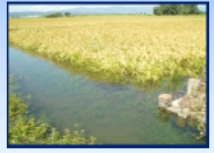
水田が一時的に浸水

水田の浸水被害を軽減するため、浸水時間の短縮を目的として、ポンプ能力を決めています。したがって、強い雨が降り、ポンプ能力以上に流域からの水が流れてくる時は、内陸側において浸水することがありますので、ご理解くださいますよう、よろしくお願いいたします。