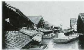
家が浸かる被害！ (明治29年9月)

琵琶湖に流れ込む河川は大小460本ほどありますが、流れ出る河川は瀬田川1本だけです。かつては大雨が降ると琵琶湖の水位が上昇し、琵琶湖周辺の土地の低いところが水に浸かっていました。 現在では、土地の低い琵琶湖沿岸に築造した湖岸堤(50.4km)、河川・水路に設置した水門・樋門(137か所)、排水するために設置したポンプ場(14か所)などによって、琵琶湖沿岸の洪水による浸水被害の軽減を図っています。 大雨が降って琵琶湖の水が内陸側へ逆流を始めるような場合には、「内水排除(ないすいはいじょ)」という操作を行います。