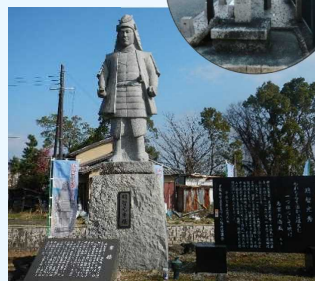
坂本城址公園の光秀像

坂本城址公園には光秀の像があり、公園周辺に坂本城址碑、本丸跡碑、明智塚などがあります。