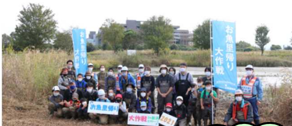
参加して頂いた皆さん