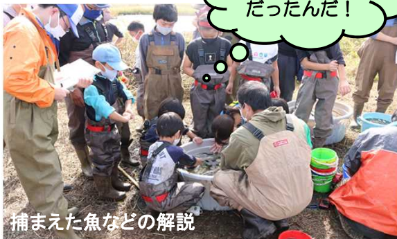
捕まえた魚などの解説